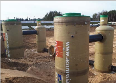
Индустриальный парк "Великий камень" "Оборудование для очистки поверхностного стока в составе ЛОС накопительного типа с самым большим в мире безбетонным аккумулирующим резервуаром АСО StormBrixx, Минск, Республика Беларусь